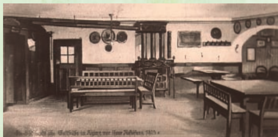
Die Liebhard'sche Gastwirtschaft in Aying vor ihrer Auflösung 1923

gewagt hatte, den normalen Rechtsweg anzumahnen, nämlich auf Weisung aus dem Kloster Bernried zu warten, wurde ihm eine Prügelstrafe zuteil und außerdem musste er die saftige Gebührenrechnung für die Gemeinde auslegen.