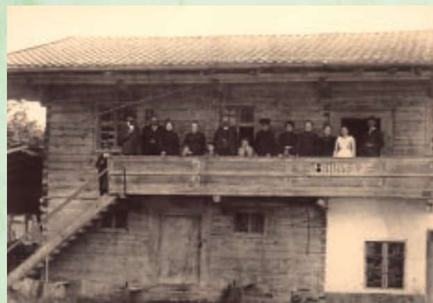
Das Jacklhaus um 1900

und geschnitzten Eichentüren. Er brannte am 27. August 1921 nieder und an seiner Stelle wurde dann der Brauereigasthof errichtet.