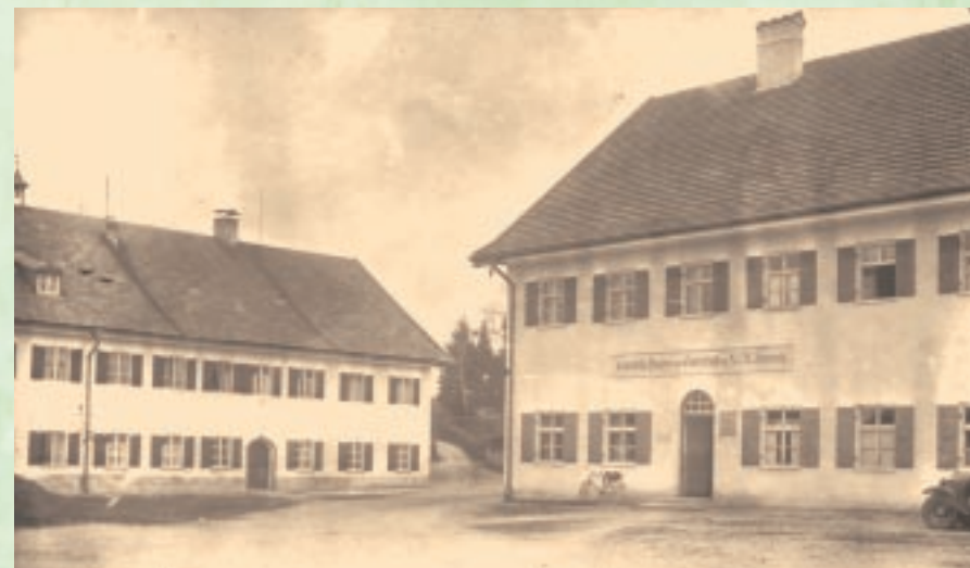
Links die ehemalige Brauerei-Gaststätte Johann Liebhard, rechts der 1923 an Stelle des Jacklhauses erbaute Brauereigasthof